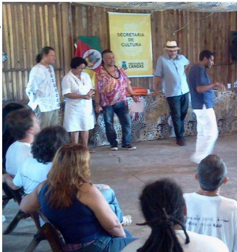
O encontro reuniu participantes do Brasil, Argentina, Uruguai,

se utilizar as rádios comunitárias entre os países, divulgando conteúdo em espanhol e português, como forma de diminuir as diferenças entre as culturas dos povos. Esse seria um dos primeiros passos para que se estabeleçam políticas culturais integradas. “Queremos uma campanha continental na América Latina, defendendo uma política pública que disponibilize 5% do orçamento de cada país para a cultura e 1% para a cultura viva”, explicou Jorge.