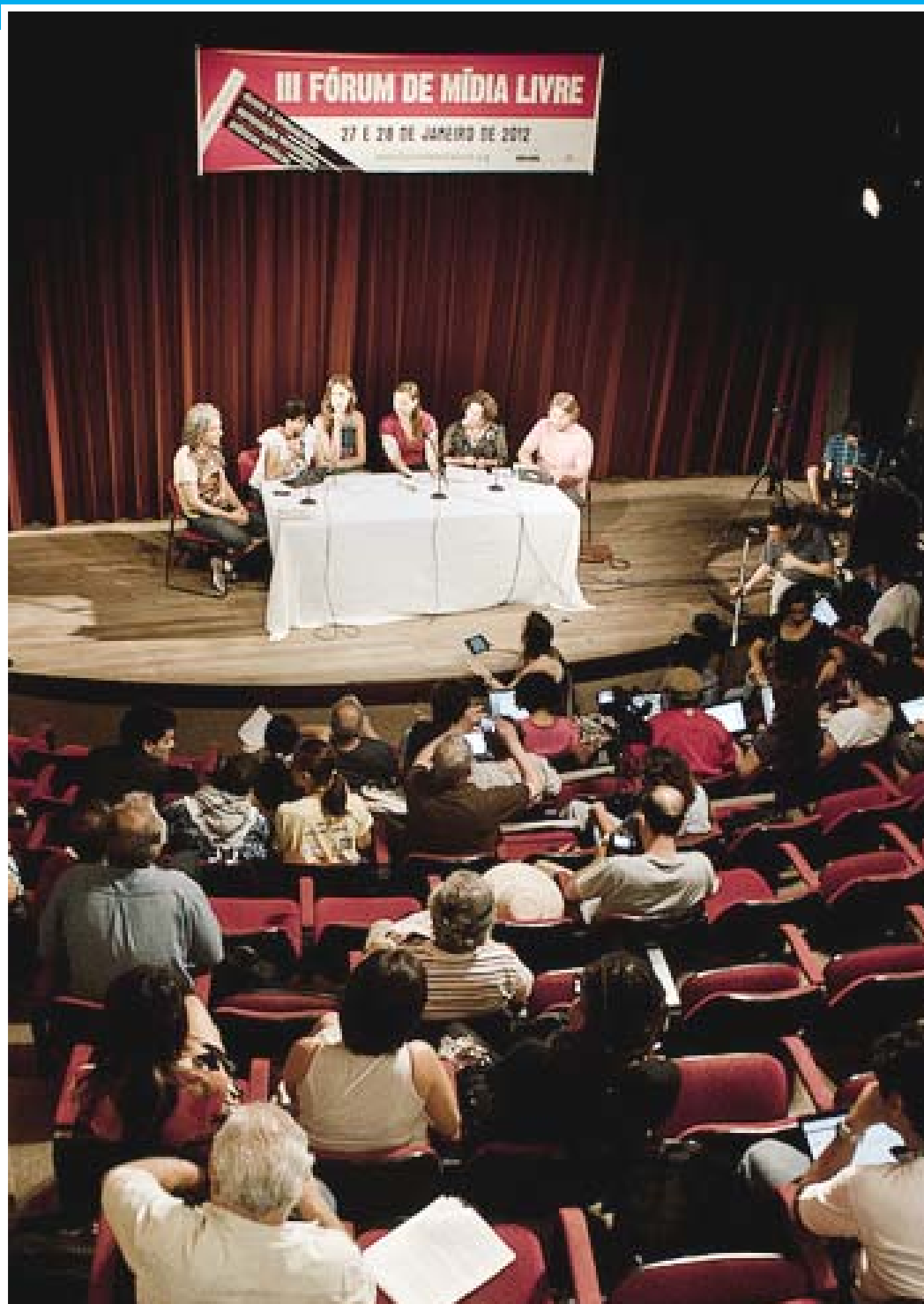
Coletivo Fora do Eixo