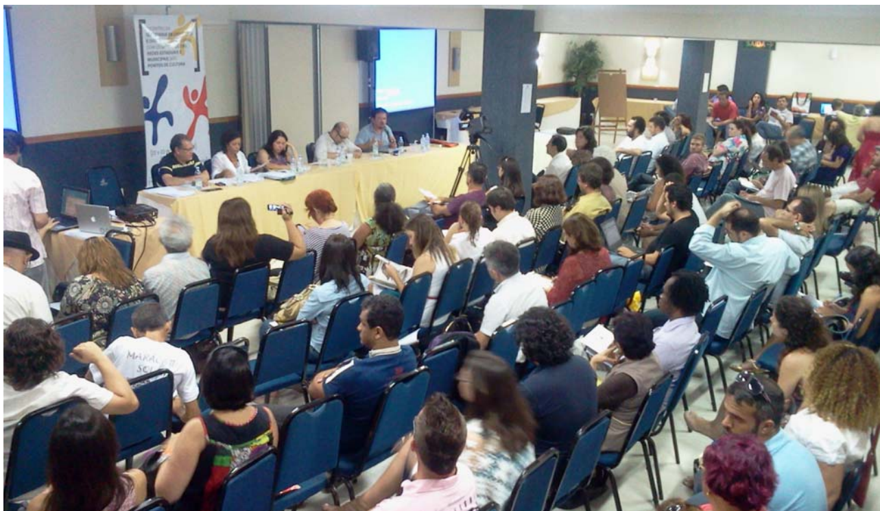
As atividades reuniram representantes de Pontos de Cultura e gestores públicos de todo o Brasil

Texto: Thiago Skárnio e LuZuê